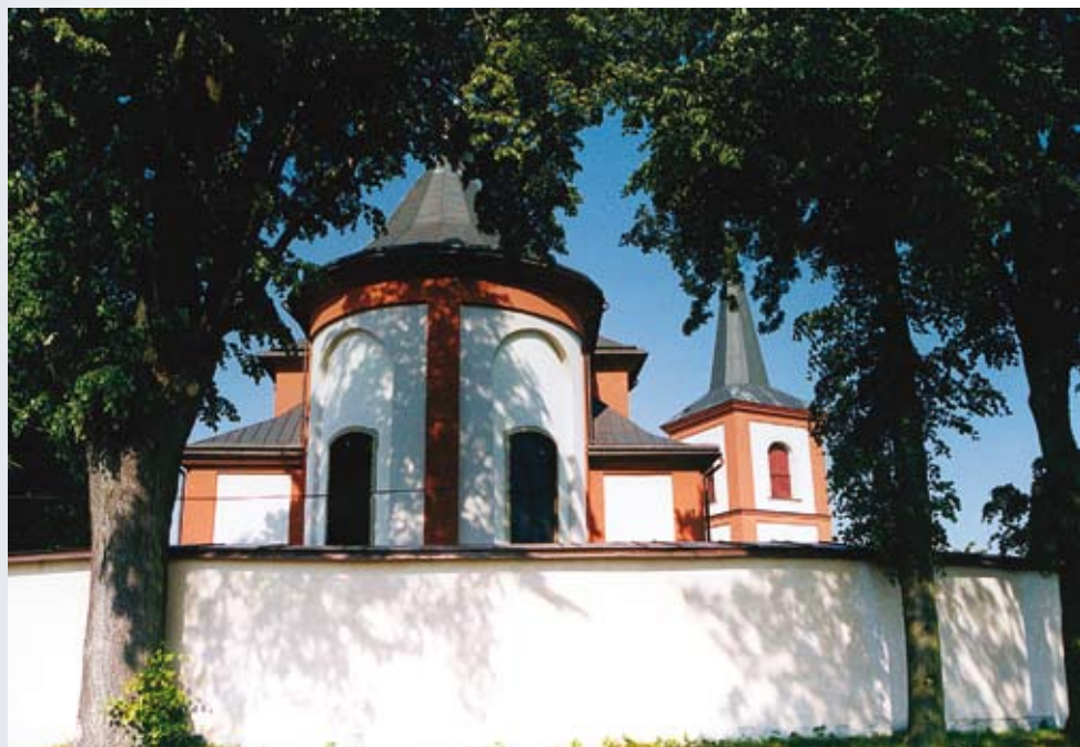
Kostel Nanebevzetí Panny Marie v Hemžích u Chocně